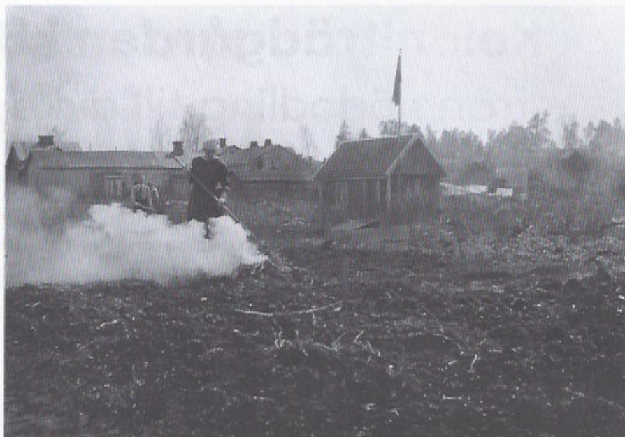
Markförbättring i Brunakärr 1920.

Det var år 1918 som Helsingfors stad, efter långa förhandlingar tilldelade ett fem hektar stort område till Martha i Hel-